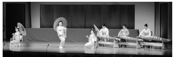
12月23日 アイザック小杉文化ホール ラポール

12月25日(木)に社会福祉法人市野瀬福祉会戸出西部保育園にて富山県立小杉高等学校吹奏楽部が演奏を行いました。出演者全員サンタクロースの帽子をかぶりクリスマスらしい雰囲気を出し、「ようかい体操第一」、「アンパンマンのマーチ」、「クリスマスKSGスペシャルメドレー」など子供たちに人気がある曲を出演者のパフォーマンズや楽器紹介を交えながら5曲披露し、大変盛り上がりしました。