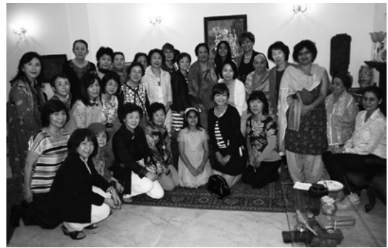
《富山県華道連合会 参加者》