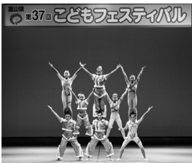
中国遼寧省・瀋陽民族芸術学校

第37回富山県子どもフェスティバルの展示が、平成26年11月8日(土)～10日(月)にわたり富山国際会議場にて開催されました。展示部門では、児童画291点、書725点、写真21点、童画16点の応募があり、子どもたちのありのままの自由な感性で描かれた作品が展示され、訪れた来場者の目を惹き寄せました。文芸部門は、創作童話29点、詩42点、短歌150点、俳句732点、川柳47点の応募がありました。