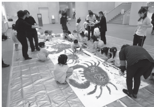
子どものための絵画ワークショップ