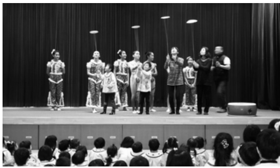
12月8日 学校法人清泉学園いずみ幼稚園

12月8日(月)に学校法人清泉学園いずみ幼稚園にて中国遼寧省・瀋陽民族芸術学校の生徒8人による中国雑技公演が行われました。最初に、華やかな「オープニングダンス・ジャスミン」から始まり、「皿回し」、「じゅわたん回し」など見ごたえのある6演目を披露。技が決まるごとに園児たちは歓声を上げ、会場は大いに盛り上がりました。また、間近で見ると中国雑技の技術の高さに圧倒され、迫力のある公演を夢中になって見えました。公演では、園児たちに皿回しの仕方を教える場面もあり、中国雑技の楽しさも体験することができました。