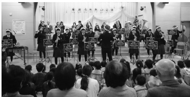
12月25日 社会福祉法人市野瀬福祉会戸出西部保育園

12月25日(木)に社会福祉法人市野瀬福祉会戸出西部保育園にて富山県立小杉高等学校吹奏楽部が演奏を行いました。出演者全員サンタクロースの帽子をかぶりクリスマスらしい雰囲気を出し、「ようかい体操第一」、「アンパンマンのマーチ」、「クリスマスKSGスペシャルメドレー」など子供たちに人気がある曲を出演者のパフォーマンズや楽器紹介を交えながら5曲披露し、大変盛り上がりしました。