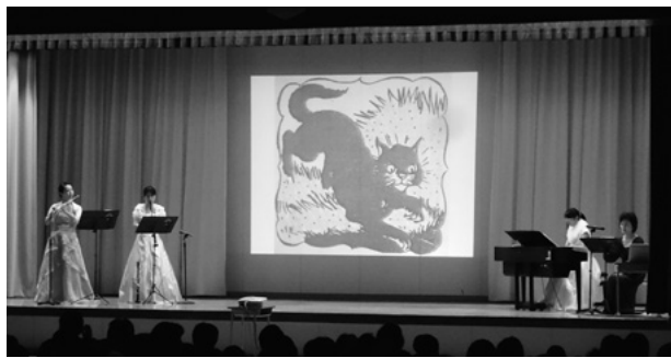
12月9日 富山県立しらとり支援学校

12月9日(火)の富山県立しらとり支援学校では洋楽のリトル・フロリアと中国雑技の中国遼寧省・瀋陽民族芸術学校が出演。最初の洋楽公演「ピーターと狼」では、スクリーンに物語を投影し、ナレーションに合わせてピアノ、フルート、クラリネットを演奏。生徒たちは、動物の鳴き声などを楽器で表現した公演に興味津々でした。次の中国雑技では「ヨーガ柔術」など体の柔らかさ・しなやかさを披露。最後に出演者全員による高度な組み技「小武術」で幕を閉じました。