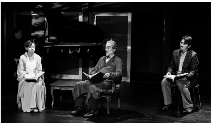
「モリー先生との火曜日」