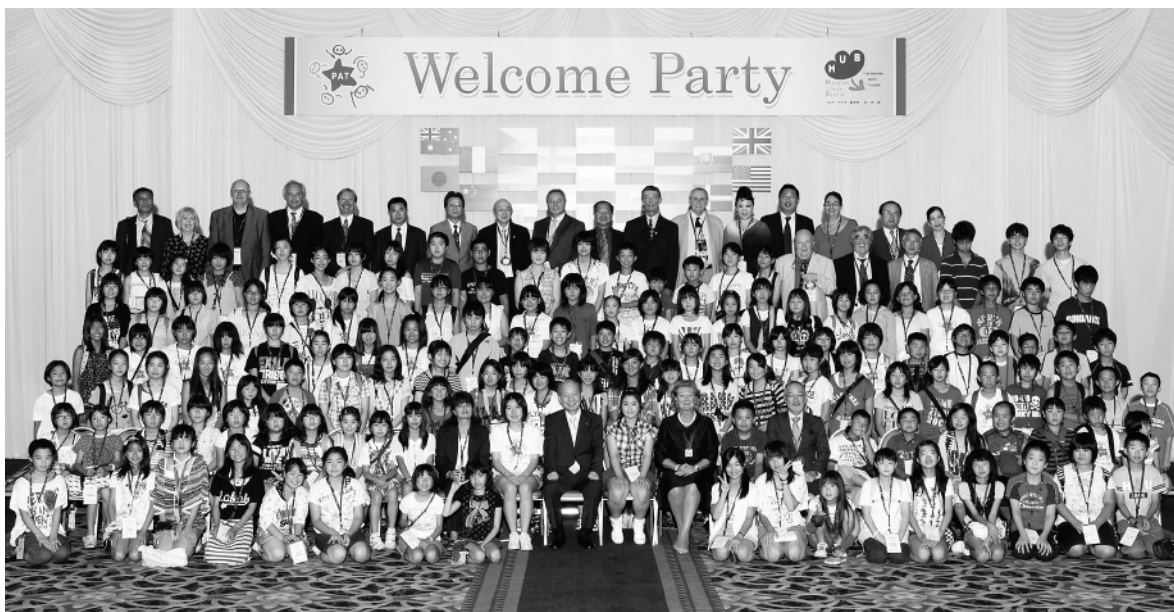
福島・宮城・岩手の東北3県の子供たちとの記念写真