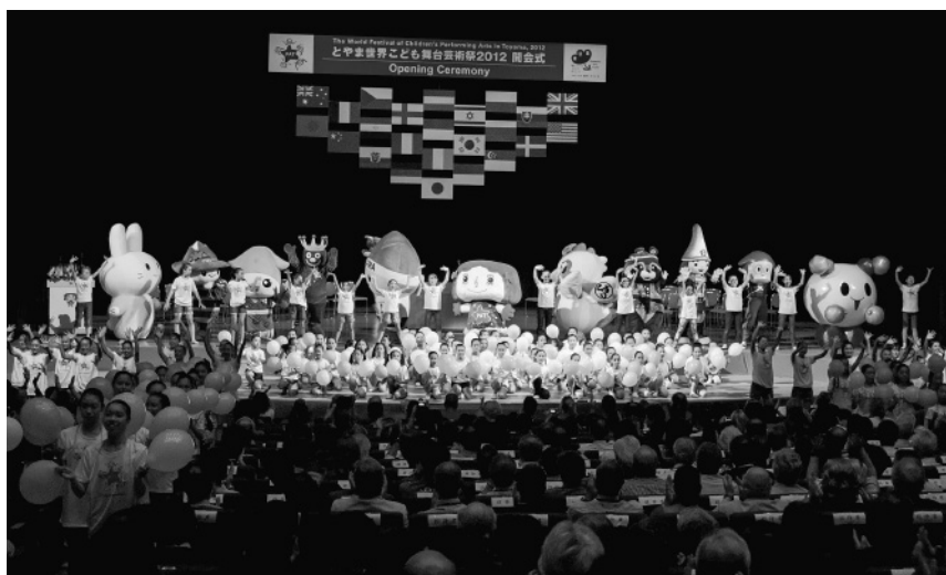
開会式前パフォーマンス「絆・KIZUNAプロジェクト」