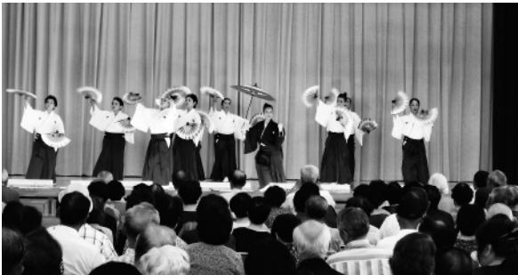
9月22日 富山市立山室小学校体育館

のトトロ、さんぽ」など6曲を演奏。楽器の紹介も行い、子供たちは興味深く聞いていました。 9月22日(土)は、渋川流剣詩舞道菊帆会による詩吟剣舞の公演が富山市立山室小学校体育館で行われ、「祝賀の詞」や「水戸八景」など5演目を披露。力強い剣さばきや舞に、会場を埋めた観客らは見入っていました。 9月27日(木)富山市立藤ノ木中学校に於いて、県日本舞踊協会・県