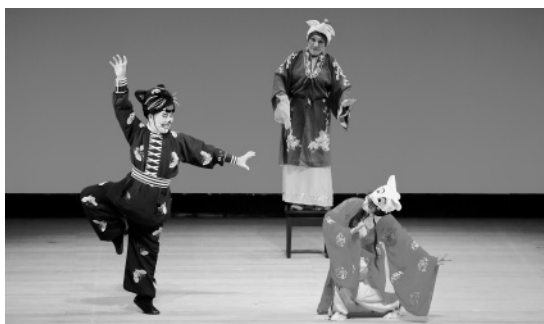
伝統芸術センター (シンガポール)

また、ハンガリー・ザラ県ザラエゲルセグ市、韓国江原道、ベルギー、オーストラリアの子供たちから創作童話6作品が特別に寄せられました。