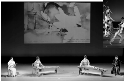
10月14日 氷見市民会館