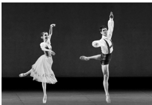
ボヘミアバレエ団 (チェコ) 「バレエ・ガラ」