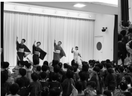
10月12日 社会福祉法人市野瀬福祉会 戸出西部保育園

舞い、「桃太郎」では、子供たちも踊りに参加するなど、和やかな公演となりました。 10月14日(日)の大正琴、洋舞、邦楽の公演は、氷見市民会館で行いました。第1部は、琴城流富山琴翔支部による大正琴の演奏。「情熱の花」、「川の流れるように」など計3曲を、情感あふれる演奏で披露しました。第2部は、和田朝子舞踊研究所による「モーツァル