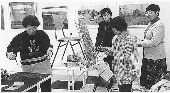
ホルトバージ美術キャンプ

の言葉と身振り手振りでの交流だったそうですが、絵を媒介にしているからか、何となく通じたそうです。