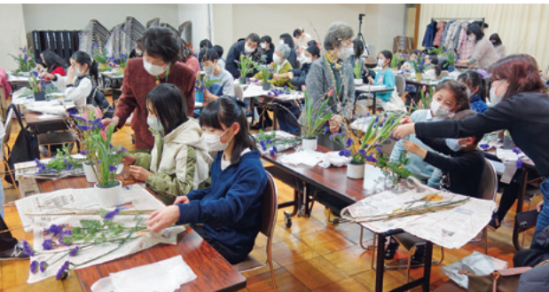
いけばなワークショップ (指導: 県華道連合会)