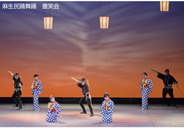
麻生民踊舞踊 豊笑会