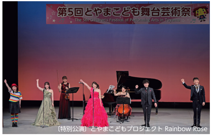
〔特別公演〕とやまこどもプロジェクト Rainbow Rose