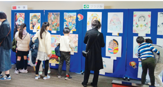
海外8カ国の子どもの絵を展示