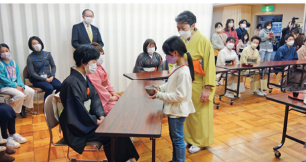
茶道ワークショップ (指導: 県茶道連盟)