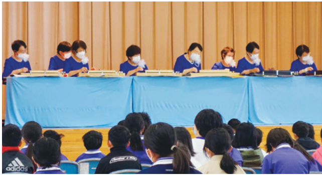
10月25日(火) 砺波市立鷹栖小学校