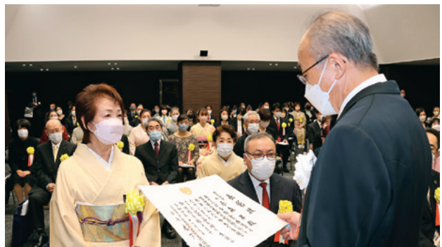
令和4年度芸文協表彰式