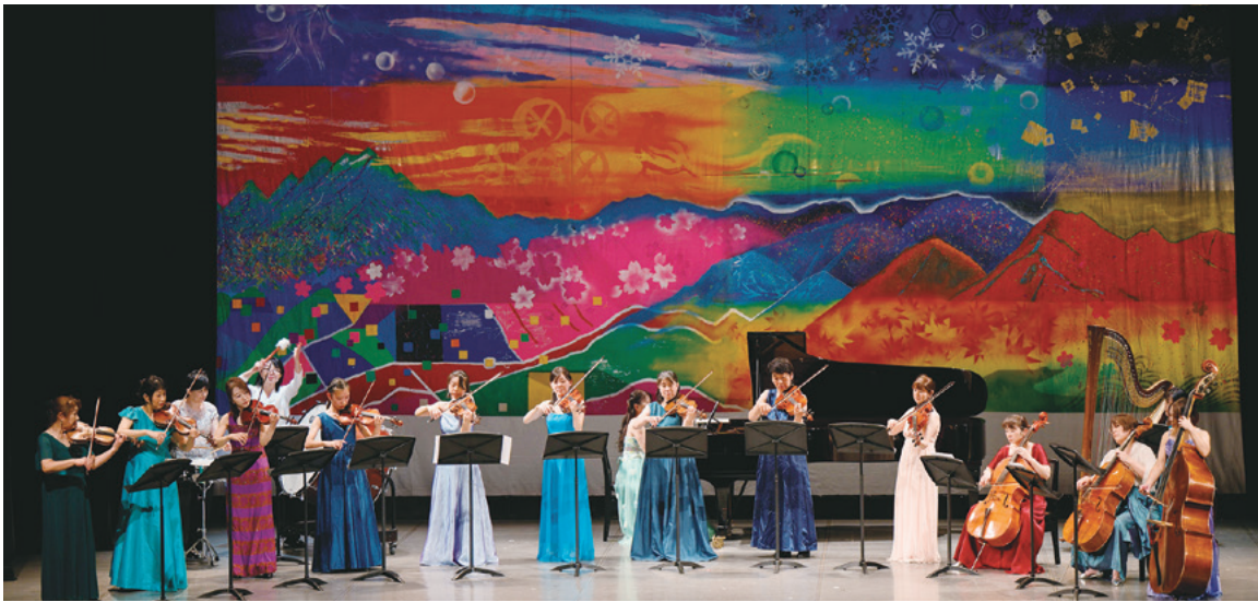
県美術連合会共同制作の舞台背景幕の前で演奏するOASISアンサンブル

学校書道部による書道パフォーマンスのコーナーが幕開けを飾り、祝祭に相応しく華やかで盛りだくさんの公演となりました。