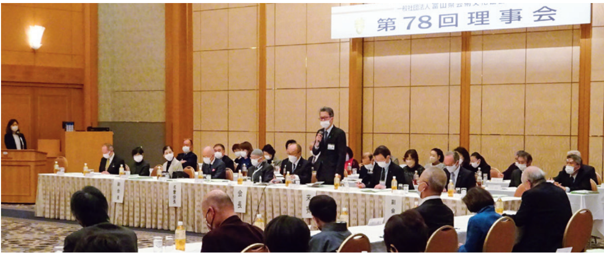
広島伸一県生活環境文化部長よりご祝辞

また、「いけばな公募展」「青少年美術展」「とやまこども舞台芸術祭」、機関誌「藝文とやま」や文芸誌「とやま文学」の発刊など、例年の事業を実施します。