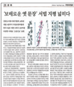
2022年11月30日「江原道民日報」掲載記事

書芸作品を通じた本交流事業は、江原道女流書家協会との協力のもと、2009年以来継続して実施しており、来年度は令和5年5月26日(金)〜6月6日(火)の期間、韓国江原道で開催予定です。