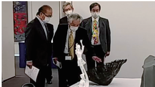
第76回富山県美術展