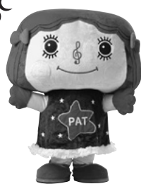
マスコットキャラクター PATちゃん

下記のお問い合わせ先、またはウェブサイト ( https://pat-festival.jp/ ) よりお申し込みをお願いいたします。