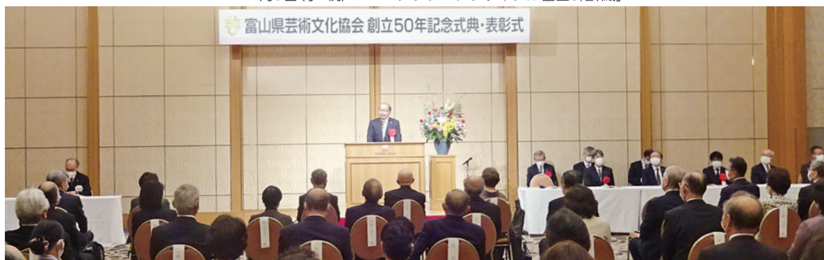
富山県芸術文化協会 創立50年記念式典・表彰式