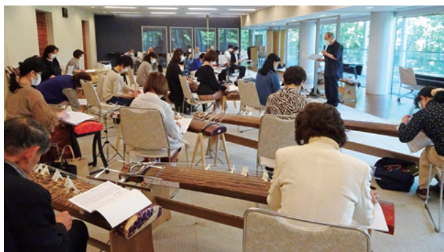
芸術文化指導者招へい事業(6月~令和4年3月)