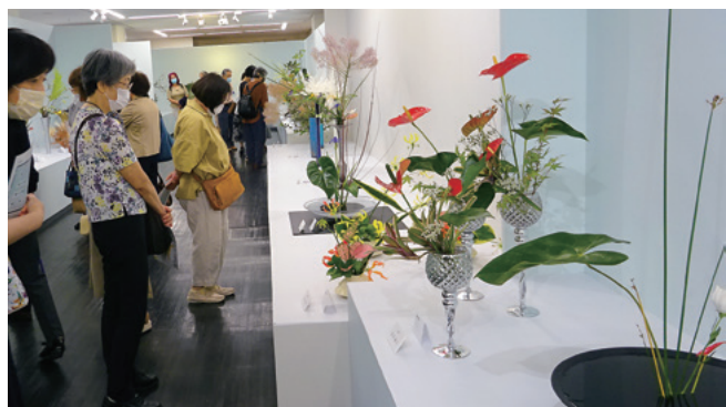
第27回富山県いけばな公募展