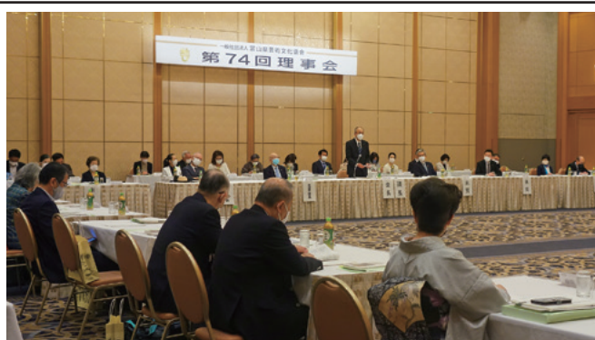
第74回・第75回理事会