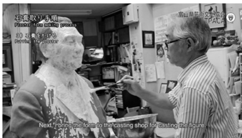
「とやまアトリエ散歩」 彫刻家連盟

本事業の一環として、県工芸作家連盟と彫刻家連盟アトリエ訪問動画を制作し、英語字幕を付けて芸文協YouTubeに公開しました。ぜひご覧ください。