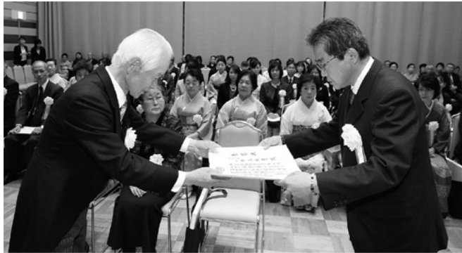
平成30年度 芸文協表彰式