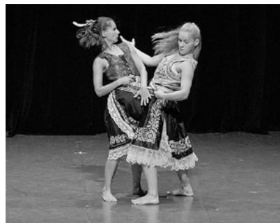
国際交流公演(チェコ・プラハ芸術大学音楽舞踊学部非言語学科)

国際交流公演として、チェコ・プラハ芸術大学音楽舞踊学部非言語学科が作品を披露。言葉を発さずに自身の身体を駆使し、独特の世界観を感性豊かに表現しました。会場からは時折笑い声上がり、言葉の壁を越えて観客を楽しませました。