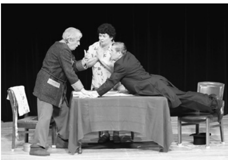
ハンガリー・劇団プレイヤーズ・スタジオ・デブレツェン