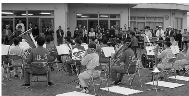
11月11日 南砺市菘谷公民館

公民館で開催された吹奏楽の公演には、会場の地元校である南砺福野高等学校の吹奏楽部が出演。「にじいろ」「ヤングマン」等、耳になじみのある華やかでリズムカルな曲目を披露しました。当日は天候に恵まれ、観客は爽やかな秋空のもと、野外での演奏パフォーマンスを楽しみました。演奏者は赤や緑などカラフルなつなぎに身を包み、曲の途中にはダンスを挟むなど、会場を大いに盛り上げ、にぎやかな公演となりました。