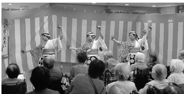
11月7日 特別養護老人ホームかがやき

催された民謡民舞公演には、日本民謡研究会富山県支部民友会が出演しました。色鮮やかな衣装に身を包んだ出演者が、「花笠音頭」や「のんのこ節」など全国各地の民謡や、「こきりこ節」「越中おわら節」など地元富山のなじみの民謡10曲を披露しました。観客は手拍子をしたり一緒に口ずさんだりと、温かい雰囲気の中、公演を大いに楽しみました。