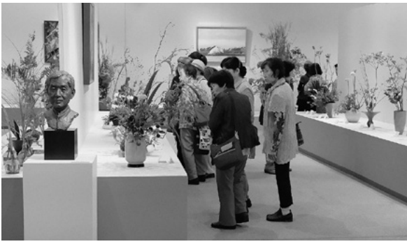
いけばなと美術作品の展示