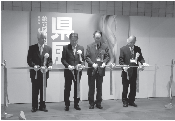
開会式テープカット

2日(土)には、朝9時30分からの開会式に引き続き、各部門で県外審査員の先生方による講評がありました。会場には講評に聞き入る多くの出品者や観客が集い、入賞・