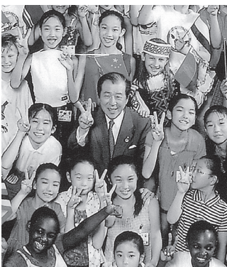
2000年とやま世界こども演劇祭にて