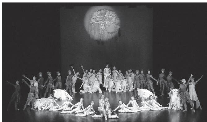
「地球に生まれた子供たち」