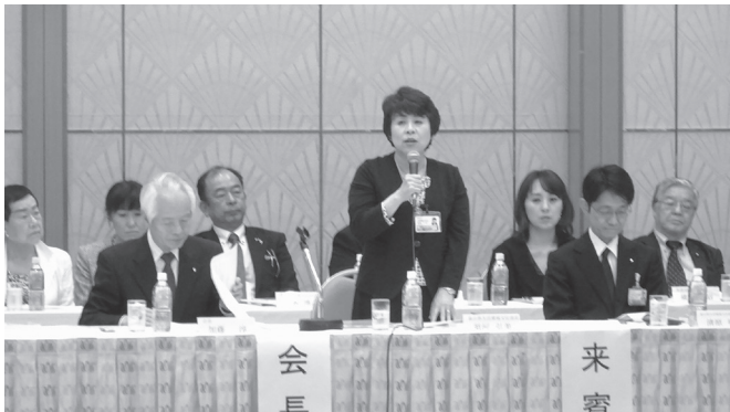
第66回理事会 須河弘美県生活環境文化部長より祝辞