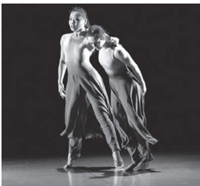
プラハ・ボヘミアバレエ団「霧の中で」

なお本作は、今年7月に開催予定の「とやま世界子ども舞台芸術祭2016」のオープニング公演でも上演されます。