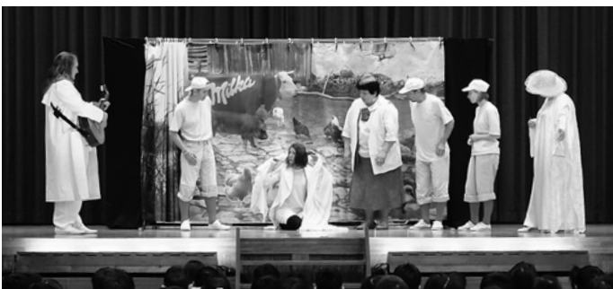
劇団プレイヤーズ・スタジオ・デブレツェン(ハンガリー)による「みにくいあひる」日本語上演

箏の音色が響き渡りました。 劇団プレイヤーズ・スタジオ・デブレツェンは、2月29日から連日「みにくいあひる」を日本語で上演。アンデルセンの「みにくいあひるの子」を基に、おなじみの童話を独自の切り口でアレンジした公演に子どもたちは魅了されました。 劇団プレイヤーズ・スタジオ・デブレツェンは、6月29日(水)～7月6日(水)にかけて開催されるプレ公演にも、再び出演する予定です。