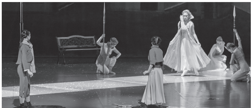
ドラマチック・ダンス「雪の女王」