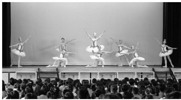
和田朝子舞踊研究所

し、「シューベルトより交響曲第5番」、「青空の下、キミのとなり」など、躍動感あふれる8演目を披露しました。