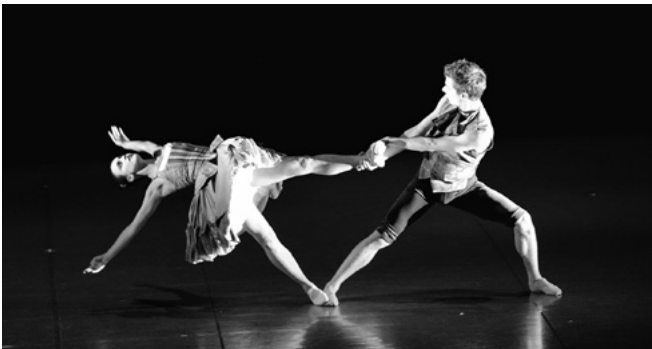
国際交流公演 (チェコ・プラハ芸術大学舞踊学科)