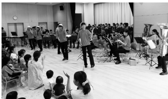
8月20日 社会福祉法人大門福祉会水戸田保育園

8月20日(木)社会福祉法人大門福祉会水戸田保育園に於いて平成27年度県民ふれあい公演の最初の公演が行われました。射水市立射北中学校吹奏楽部による「ラッスンゴレライ」や「ようかい体操」など話題の曲を演奏し、園児は吹奏楽部の生徒のダンスに合わせて一緒に体を動かして楽しんでいました。 9月7日(月)の認定こども園城南もなみ学園では、詩吟剣舞と日本舞踊の公演が行われました。第一部の渋川流剣詩舞道恵承会は、「荒城の月」と「古城」を披露。ファイナーレの「赤とんぼ」では園児も一緒に歌い参加しました。第二部の日本舞踊公演では、「もみ