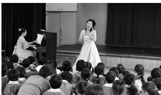
11月11日 社会福祉法人秀愛会大沢野ちゅうおうこども園

のしらべより「秋」まで、バラエティー豊かな曲を演奏。アンコールの「麦の唄」の後には大きな拍手が送られました。 11月10日(火)は、砺波市文化会館において洋楽のハープロリオ花音(かのん)と声楽のTOYAMA グラン・ソレイユが出演。洋楽公演では「日本の曲より秋のメドレー」や「カノン」など4曲を演奏。フルート、ヴィオラ、ハープの美しい音色が会場に響きわたりました。声楽公演では、演出にこだわった「オペラ「カルメン」より「ハバナネラ」、「闘牛士の歌」など披露。最後には、洋楽と声楽のコラボレーションも披露し、充実した公演になりました。 11月11日(水)に社会福祉法人秀愛会大沢野ちゅうおうこども園で声