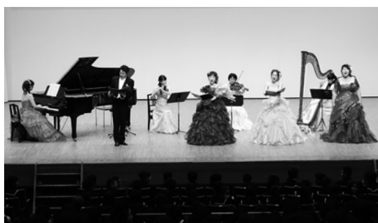
11月10日 砺波市文化会館

楽とピアノ、洋舞の公演を行いました。声楽とピアノ公演では、「サウンドオブミュージック」より「エーデルワイス私のお気に入り」など園児に優しく語りかける