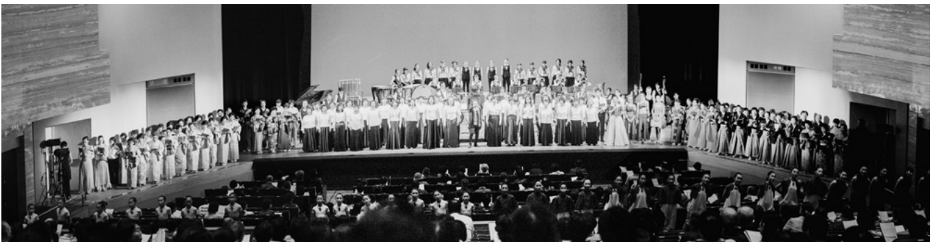
オープニングフェスティバル フィナーレ