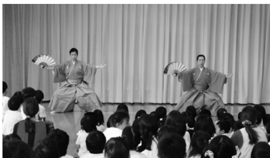
9月7日 認定こども園城南もなみ学園

8月20日(木)社会福祉法人大門福祉会水戸田保育園に於いて平成27年度県民ふれあい公演の最初の公演が行われました。射水市立射北中学校吹奏楽部による「ラッスンゴレライ」や「ようかい体操」など話題の曲を演奏し、園児は吹奏楽部の生徒のダンスに合わせて一緒に体を動かして楽しんでいました。 9月7日(月)の認定こども園城南もなみ学園では、詩吟剣舞と日本舞踊の公演が行われました。第一部の渋川流剣詩舞道恵承会は、「荒城の月」と「古城」を披露。ファイナーレの「赤とんぼ」では園児も一緒に歌い参加しました。第二部の日本舞踊公演では、「もみ