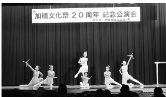
10月17日 加積公民館(魚津市農村環境改善センター)

じの橋・京人形」や「藤娘」など5演目を優雅に披露。様々な道具を使った踊りに、園児は興味深そうに見ていました。 10月17日(土)加積公民館(魚津市農村環境改善センター)では、大正琴と洋舞と洋楽の公演が開催されました。最初の大正琴公演は、アンサンブルミズキの息の合った迫力ある演奏に観客は引き込まれていました。次の大川都バレエ教室は、バレエレッスンを観客に分かりやすく紹介し、バレエの美しい身のこなしを披露しました。最後の「トラスティス(オアシス)」は、「美しく青きドナウ」から「四季